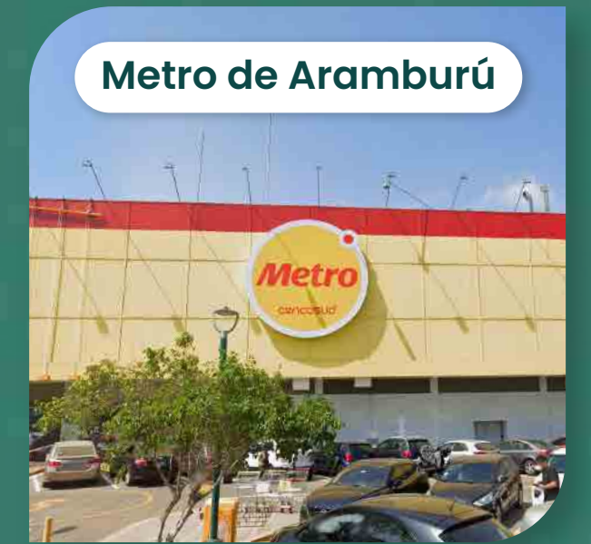
Metro de Aramburú