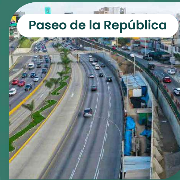
Paseo de la República